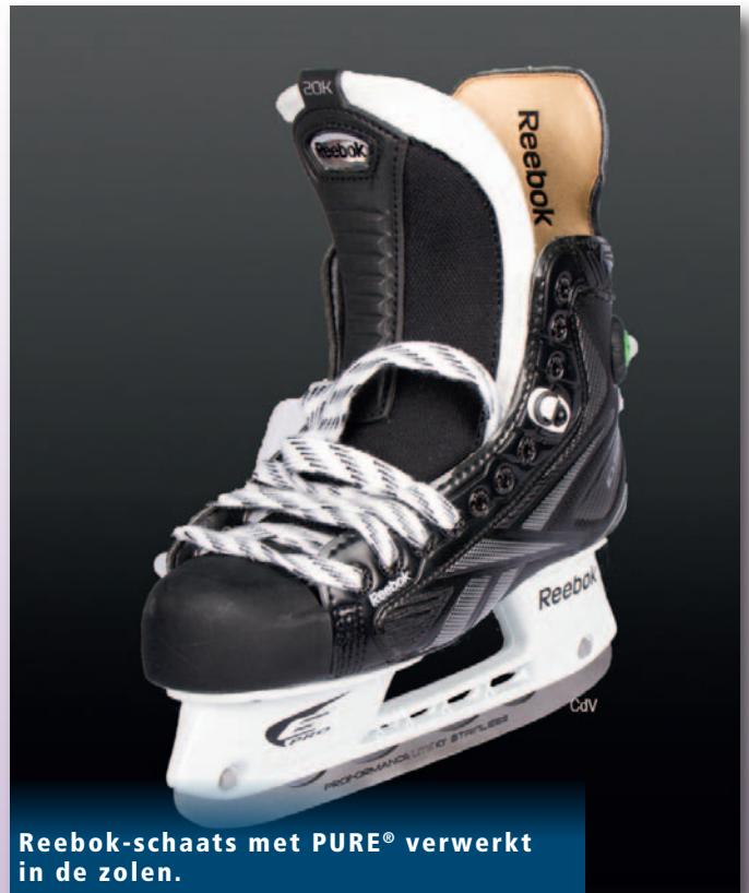
Reebok-schaats met PURE® verwerkt in de zolen.

Zowel het dames- als het herenteam van Canada wonnen goud in Sochi, waarbij menig speler van deze teams dit presteerde op Reebok-schaatsen met PURE® verwerkt in de zolen.