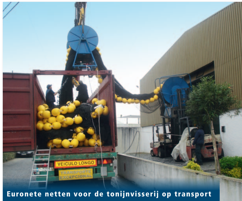
Euronete netten voor de tonijnvisserij op transport

Dankzij de goede relatie met Pevasa worden wij de gelegenheid gesteld onze netten in de eerste week van juni aan boord van hun nieuwe schip PLAYA DE RIS te testen. Op basis van alle ervaringen die zijn opgedaan tijdens