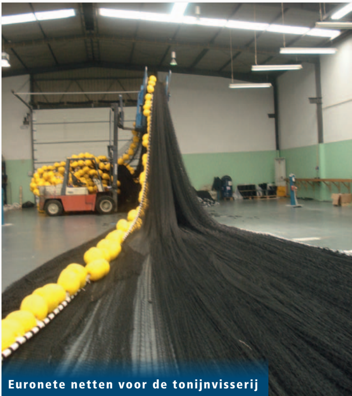
Euronete netten voor de tonijnvisserij

Wij onderscheiden ons van de concurrentie door innovatie, te beginnen vanaf de drijverlijn (synthetisch touw) met een knik-