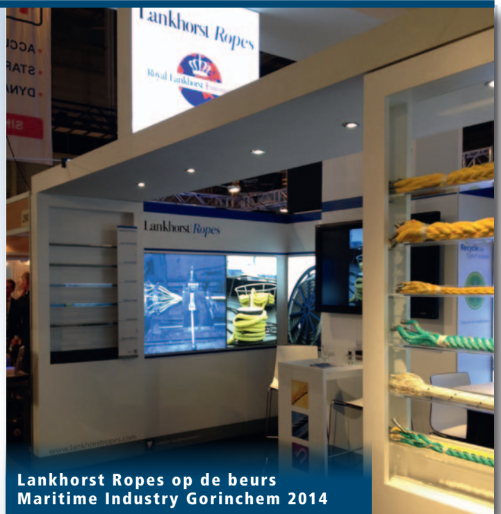
Lankhorst Ropes op de beurs Maritime Industry Gorinchem 2014